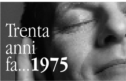
Calendario tratto dalla pubblicazione Trent'anni suonati a cura di Giuliana Antonello. Edizioni Giacché©1999 La Spezia.

In campo editoriale, ha all'attivo alcune originali pubblicazioni a stampa e diversi CD editi per Nuova ERA, Agorà e Tactus che hanno colmato importanti lacune nel panorama discografico internazionale.