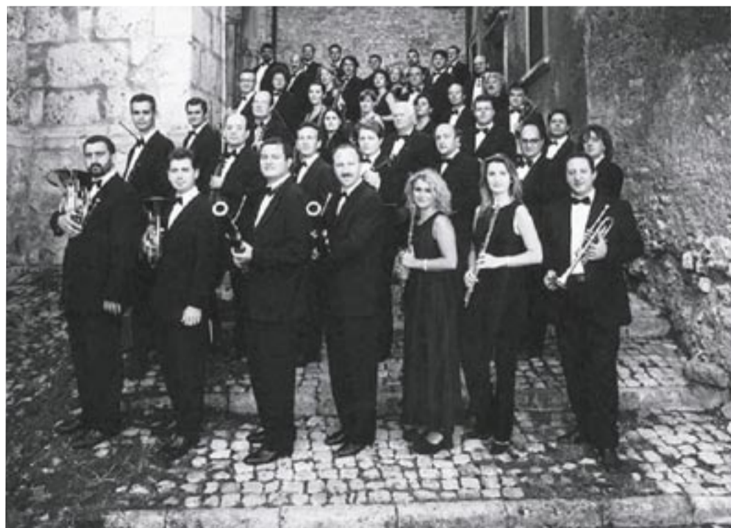
Orchestra Sinfonica Abruzzese