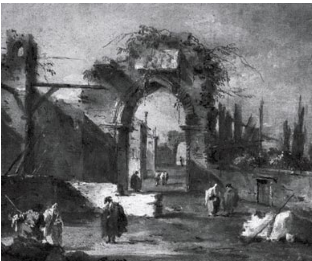
Francesco Guardi. Capriccio architettonico. La Spezia Civico Museo Amedeo Lia. Sala X